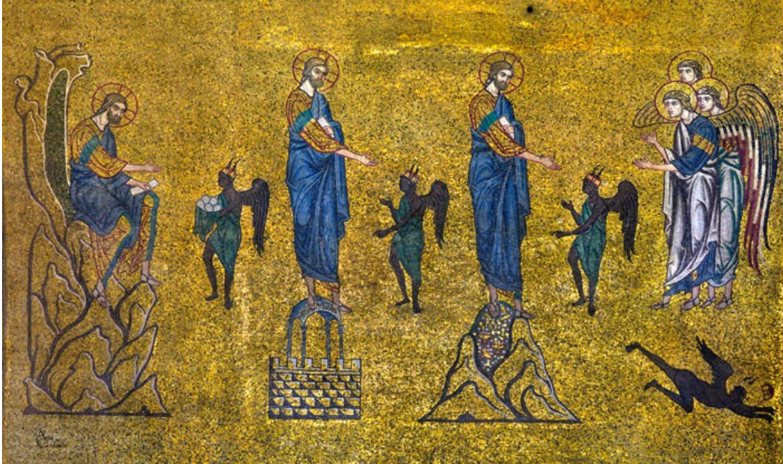
Lucas 4:1-13 Jezus door de duivel op de proef gesteld mozaiek XIIIe eeuw, San Marco basiliek, Venetie